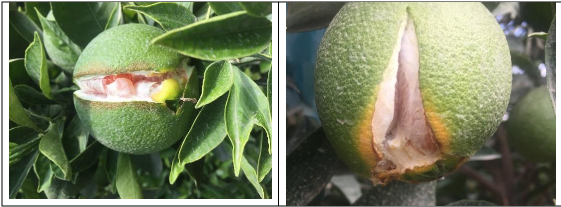
شکل ۵- شکاف خوردن میوه پرتقال‌های ناول (اسدی کنگرشاهی و اخلاقی امیری، ۱۳۹۰) Fig. 5- Splitting in Navel oranges fruit (asadi Kangarshahi and Akhlaghi Amiri, 2011)