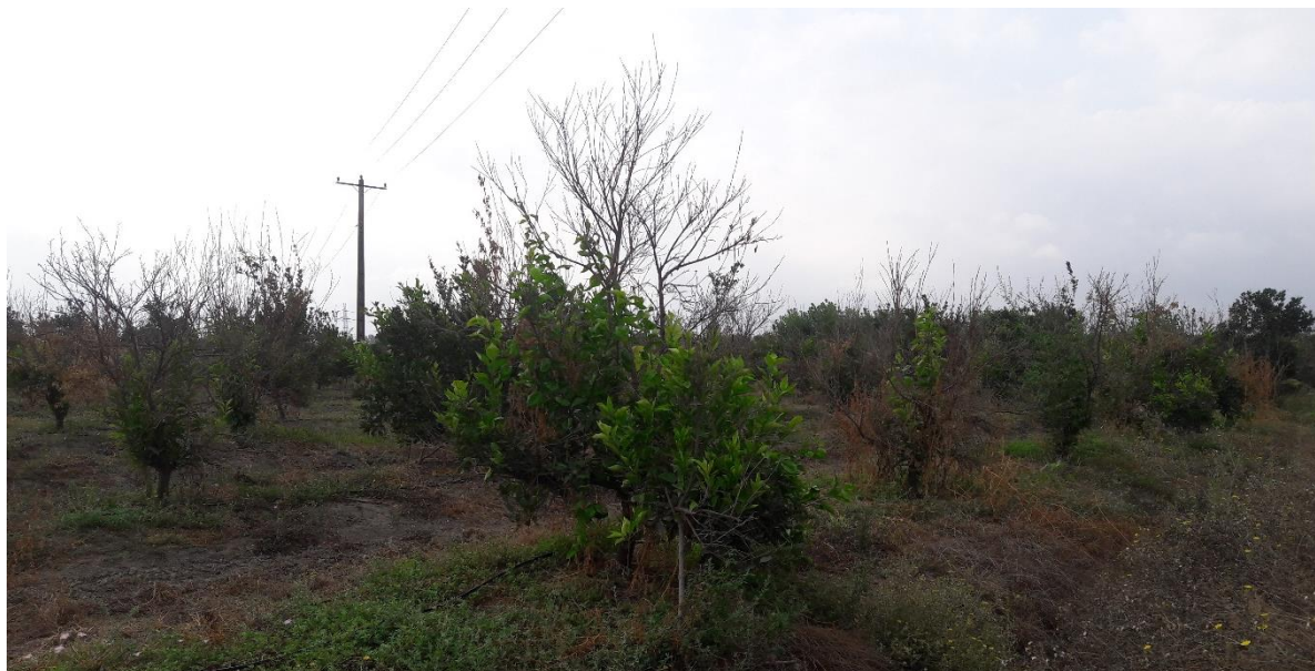
شکل ۶- خسارت شدید ناشی از تنش سرما در درختان مرکبات دارای کمبود شدید پتاسیم در شرق مازندران (۱۳۹۷) Fig 6- Severe damage caused by cold stress in citrus trees with severe potassium deficiency in the east of Mazandaran (2017)

دوم از ۱- و ۳- درجه سانتی‌گراد در شاهد به ۴- و ۹- درجه سانتی‌گراد در تیمار مصرف پتاسیم و منیزیم رسید. با توجه به نتایج این پژوهش رعایت اصول مصرف بهینه کودی برای کلیه باغ‌های مرکبات کشور توصیه می‌شود. مصرف پتاسیم پس از ریزش فیزیولوژی میوه‌چه‌ها در طول مرحله توسعه سلول‌ها (فاز دوم رشد میوه)، برای