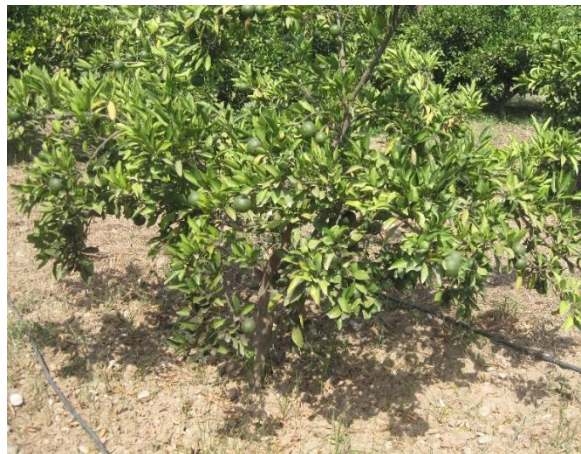
شکل ۸- تنش خشکی و کمبود پتاسیم در درختان نارنگی انشو (اسدی کنگرشاهی و اخلاقی امیری، ۱۳۹۲)

دارد و برای بسیاری از فرایندهای فیزیولوژیکی مانند تشکیل قندها، نشاسته، سنتز پروتئین، تقسیم سلولی و رشد مطلوب گیاهان ضروری است؛ بنابراین کمبود پتاسیم موجب اختلال در باز و بسته شدن سلول‌های استومات‌ها، کاهش جذب دی‌اکسید کربن، کاهش عملکرد و در نتیجه کاهش راندمان پایین آب مصرفی در محصولات خسارت دیده از کمبود پتاسیم می‌شود. (منگل و کرمبای، ۲۰۰۱؛ اسدی کنگرشاهی و اخلاقی امیری، ۱۳۹۳).