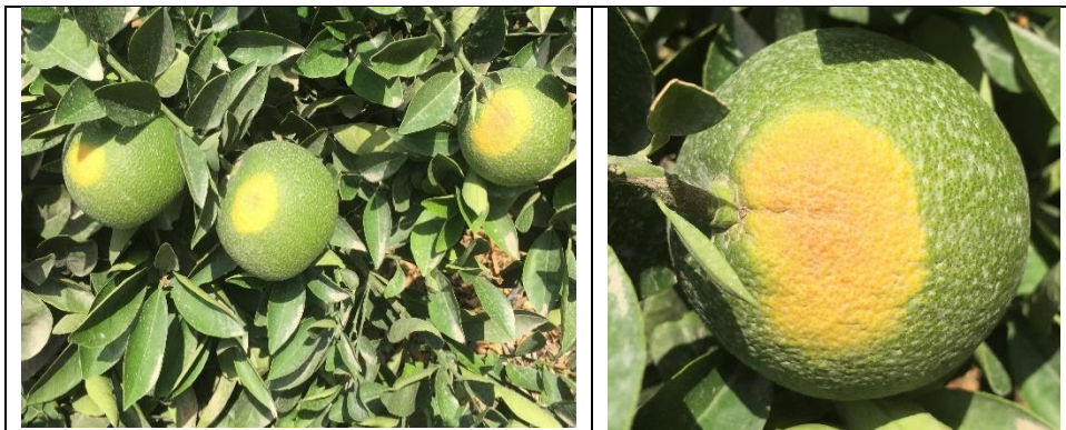
شکل ۷- میوه‌های دارای لکه‌های آفتاب سوختگی (اسدی کنگرشاهی و اخلاقی امیری، ۱۳۹۳)

کمبود پتاسیم سبب تجمع توده‌ای کربوهیدرات‌ها در برگ‌های منبع خواهد شد که موجب کاهش یا توقف تثبیت کربن فتوسنتزی می‌شود (کاکمک، ۲۰۰۵؛ گریسون، ۱۹۸۱؛ راهنمای تولید و تحقیقات مرکبات، ۲۰۰۷). هم‌زمان با این تغییرات در متابولیسم کربن فتوسنتزی، مقدار نسبی انرژی نورانی مصرف نشده و الکترون‌های نوری در گیاهان با کمبود پتاسیم افزایش می‌یابد که منجر به فعال‌سازی نوری