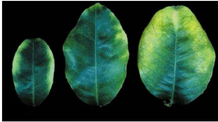
شکل ۱- علائم کمبود پتاسیم در برگ درختان مرکبات (ارنر و همکاران، ۱۹۹۹)