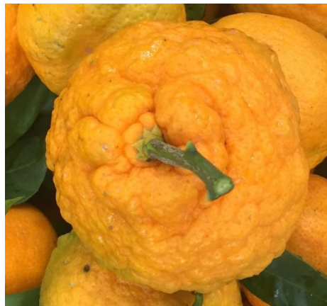
شکل ۳- تأثیر مصرف زیادی پتاسیم در سنگ‌پایی شدن میوه (اسدی کنگرشاهی، ۱۴۳۹۸) Fig 3- The effect of high application of potassium on peel thickness of citrus fruit (Asadi Kangarshahi, 2019)

جدول ۲- دامنه مطلوب پتاسیم (درصد) در برگ برخی ارقام مختلف مرکبات (شاخه‌های انتهایی میوه‌دار)